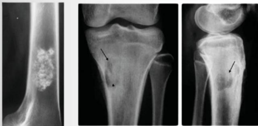
Lesões císticas ósseas, tumorais ou osteomielite.

O Kit OSTEOINJECT PRECISION, é projetado para fornecer uma solução abrangente em procedimentos cirúrgicos ósseos. Este kit é essencial para a aplicação de enxerto ósseo sintético em suas diversas aplicações, carreadores de antibiótico e enxerto ósseo autólogo, adaptando-se com eficácia a uma variedade de cenários clínicos.